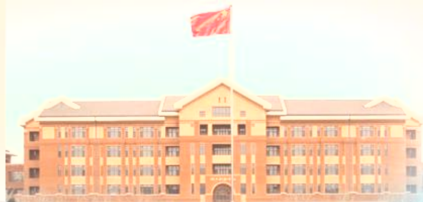
天津机电职业技术学院 TIANJIN VOCATIONAL COLLEGE OF MECHANICAL, ELECTRICAL AND ELECTRONIC TECHNOLOGY